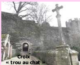
Croix « trou au chat »

le Dimanche 10 mars 2019 sur LANOUEE - JOSSELIN