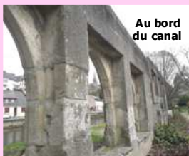
Au bord du canal