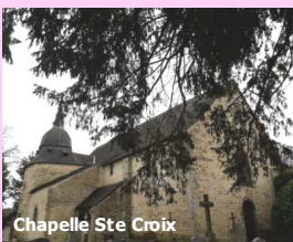
Chapelle Ste Croix

Cette marche est une occasion de prendre du temps pour la prière, la réflexion, la rencontre, la découverte des beautés cachées de notre patrimoine... et de nous mettre en route vers Pâques.